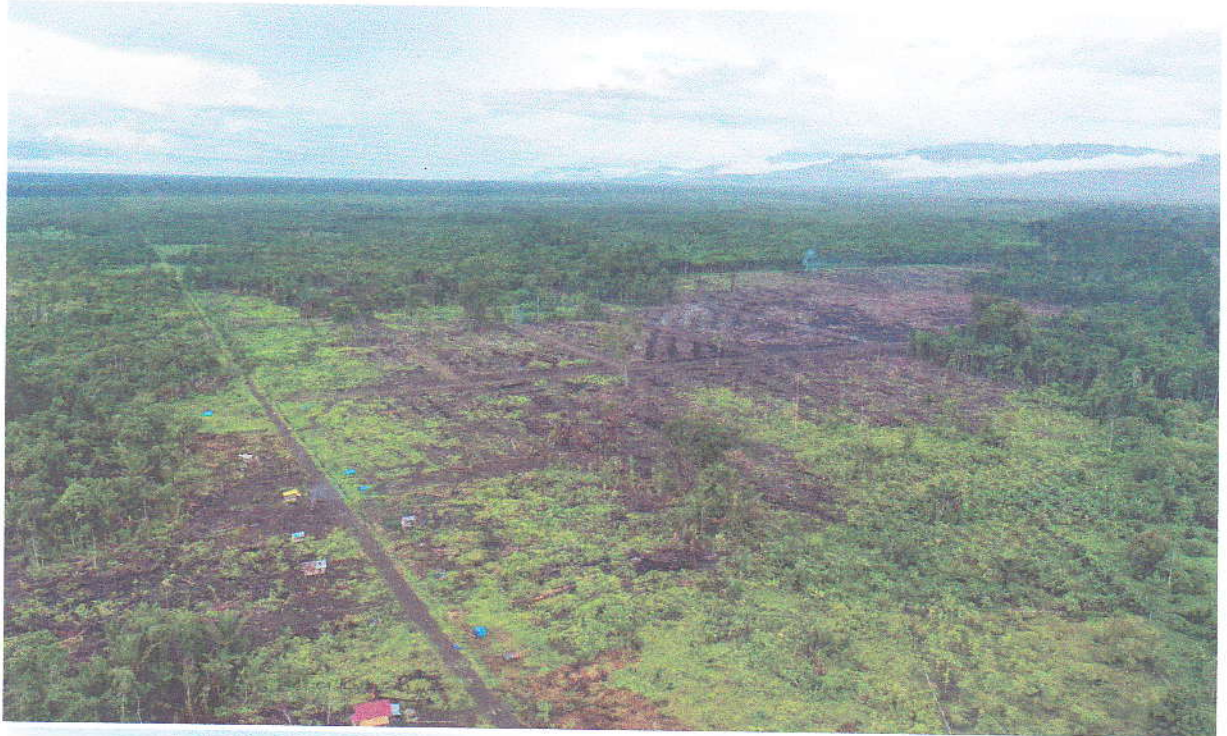
Foto Udara 3 Mei 2021 a.n Kampung Yaumumi