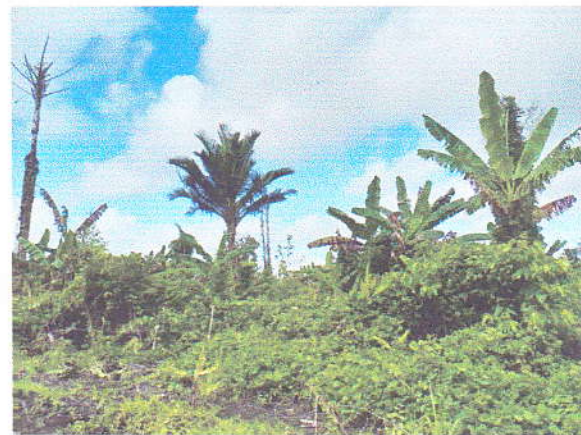
2. Kondisi lahan sekitar yang belum dibuka /dimanfaatkan untuk lokasi pemekaran Kampung Yaumumi