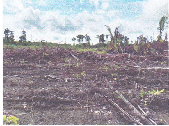
1. Lokasi Pembukaan Lahan untuk pemekaran kampung Yaumumi