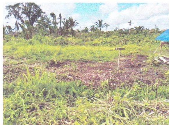
3. Rencana Pemanfaatan lahan seluas 58,6 Ha dan Lokasi yang sudah dibatas untuk untuk setiap pemilik lahan.